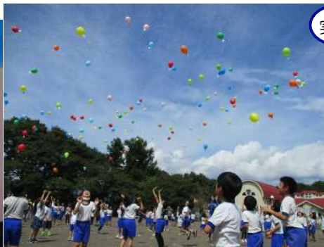
実行委員の皆さん、ありがとうございます。