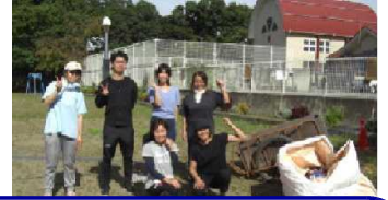
PTA 施設部の皆さん、企画・運営、ありがとうございました。

この2回の環境整備作業では、ここに書き切れないほどの場所をきれいにいただきました。おかげさまで、子どもたちの学習環境が本当にきれいになりました。ありがとうございました。