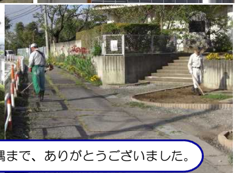
コミュニティースクール運営委員の皆さん、学校敷地の隅から隅まで、ありがとうございました。

そして、9月20日には、平根小学校創立150周年記念の事業として、ドローンによる人文字の空撮と、バルーンリリースが行われました。この事業は、歴代のPTA会長様や副会長様方で組織された実行委員会が中心となって企画・実行をしてくださいました。校章の枠と150の数字を、児童、職員、コミュニティースクール運営委員の皆さん、実行委員の皆さんで人文字を型取り、ドローンで空撮しました。これにデジタル加工で校章の中を描き込み、写真に仕上げていきます。バルーンリリースは、子どもたちが書いた将来の夢のカードを風船に付けて、児童会長のカウントで一斉に放ちました。色とりどりのたくさんの風船が青空に上がっていく様子はとてもきれいで、心に残る行事となりました。