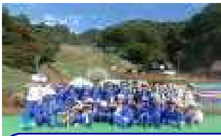
1、2年生、生活科で平尾山へ何度も行って、地域の山に親しんできました。

このように、10月は各学年が精力的に活動の場を広げ、様々な学習を通して学んできました。