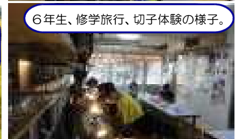
6年生、修学旅行、切子体験の様子。