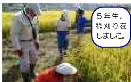
5年生、 稲刈りを しました。