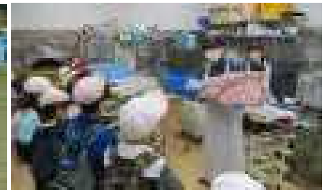
3年生、ナナース見学に行きました。